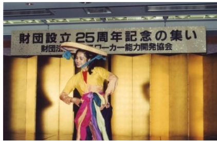
(ベトナム国民的女優 レイ・ハンさん)