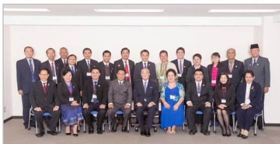
Courtesy Call on former Prime Minister Mr. Nakasone The 30th Anniversary of the Training Program for Young Leaders Feb. 6, 2015 Mr. Nakasone's office, Tokyo, Japan