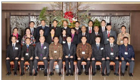
The 30th Anniversary of the Training Program for Young Leaders Feb. 5, 2015 Iikura Guest House of MOFA, Tokyo, Japan