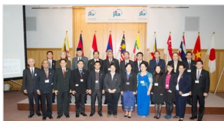
27th AJAFA-21 Executive Council Meeting (ECM) The 30th Anniversary of the Training Program for Young Leaders Feb. 6, 2015 JICA Ichigaya, Tokyo, Japan