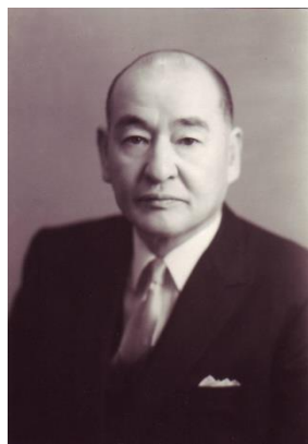
(藤井丙午初代会長)