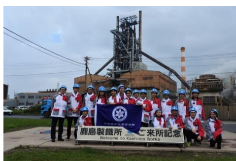
ベトナム・大学生来日研修 (2016.12) 中国・高校生来日研修 (2017.10)