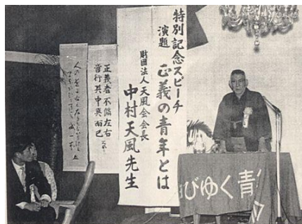
1966 「伸びゆく青年の会」