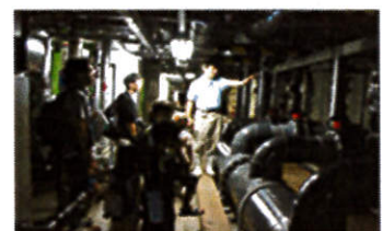
バックヤードツアー