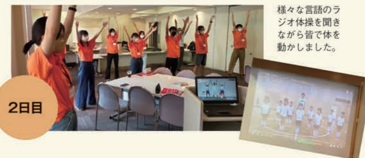
様々な言語のラジオ体操を聞きながら皆で体を動かしました。