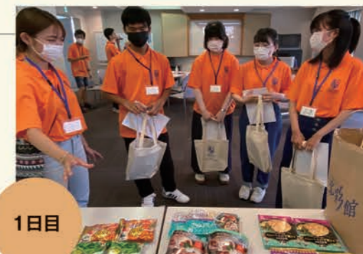
高校生に東南アジアの食べ物をお土産として配りました。