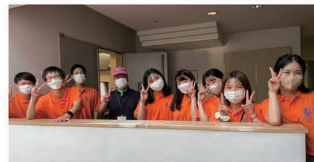
▲今回運営・参加した大学生

約半年かけて準備をしたプロジェクト。オンラインイベントの経験はあったものの、対面のイベントは初めての挑戦で、たくさんの苦難と挑戦がありました。しかし、その先にはたくさんの出会いと笑顔がありました!この機会がみんなにとって、「何か」のスタートになりますように!